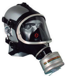
MÁSCARA FACIAL INTEIRA FULL FACE AIRSAFETY - CA 5758