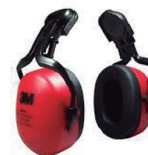
ABAFADOR POMP MUFFLER ACOPLAVEL 3M - CA 33835