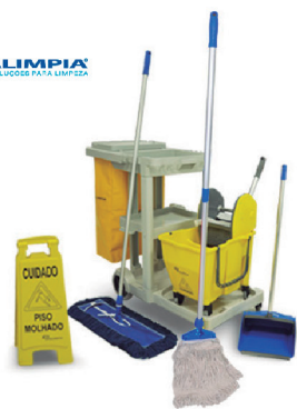
KIT COMPLETO CARRO AMERICA BRALIMPIA