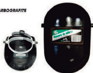
MÁSCARA SOLDA CELERON V/FIXO C/C CARBOGRAFITE - CA 6135