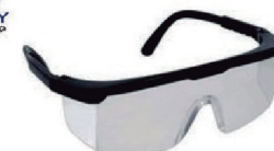
ÓCULOS FENIX INCOLOR CA 9722