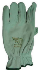
LUVA DE VAQUETA CA 19543