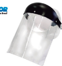
PROTECTOR FACIAL INCOLOR PLASTCOR CA 15019

TREVENTOS SEGURANÇA DO TRABALHO & LIMPEZA PROFISSIONAL