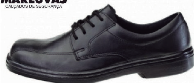
SAPATO SOCIAL DE AMARRAR MARLUVAS 4530