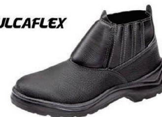
BOTA COURO ELAST BD PT VULCAFLEX CA 28498