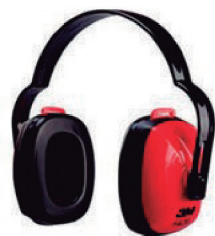
PROTETOR AUD. ABAFADOR CONCHA 1426 - CA 29176