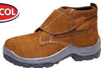
BOTA NOBUCK MAR. VELC. BRACOL CA 25684