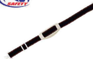
JUGULAR COM QUEIXEIRA PROSAFETY