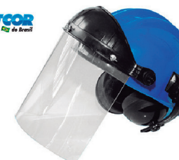
CAPACETE ACOPLADO PLASTCOR