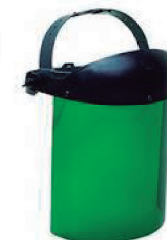
PROTECTOR FACIAL VERDE PLASTCOR CA 30115