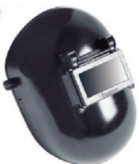
MÁSCARA CELERON VISOR ARTICULADO CARBOGRAFITE CA 6135