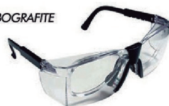
ÓCULOS DELTA INCOLOR SOBREPOR CA 12927