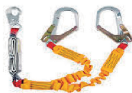
TALABARTE COM ABS HLO32YE HERCULES