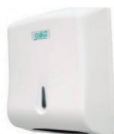
DISPENSER DE PAPEL TOALHA INTERFOLHA TRILHA