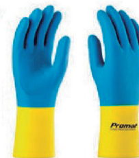
LUVA DE LÁTEX NEOPRENE P, M, G, XG - CA 6657