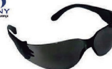
ÓCULOS ÁGUIA CINZA CA 15298