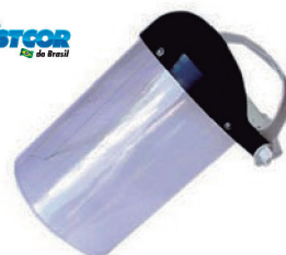
PROTECTOR FACIAL INCOLOR 08 PLASTCOLOR - CA 15019