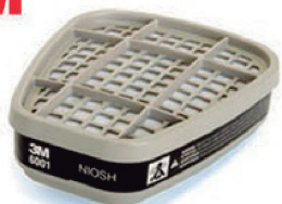
CARTUCHO VAPORES ORGANICOS 6001