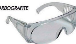
ÓCULOS PRO-VISION INCOLOR