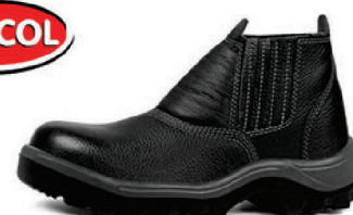
BOTA COURO S/ B BI. PT BRACOL CA 31888