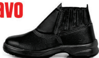
BOTA COURO S/B BIDEN. PT BRAVO CA 26706