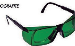
ÓCULOS DELTA VERDE SOBREPOR CA 12927