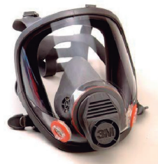
RESPIRADOR FACIAL INTEIRA 3M 6800