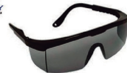
ÓCULOS FENIX CINZA CA 9722