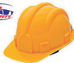
CAPACETE PLASTCOR AMARELO CA 29792