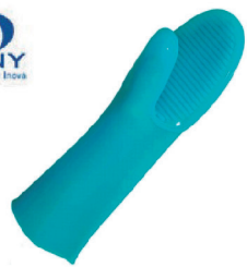
LUVA ALTAFLEX DANNY CA 16460