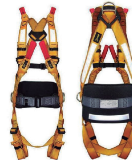
CINTO PARQUED. 3 PONTOS DE ANCORAGEM HL01202CAH2 HERCULES - CA 36649