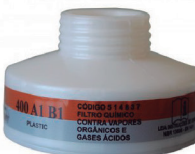
FILTRO 400 A1B1 VOGA AIR SAFETY