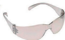
ÓCULOS ÁGUIA INCOLOR CA 14990