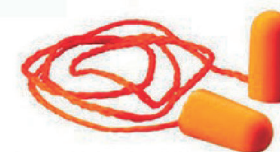
PROTETOR AUD ESP C/CORDÃO 1110 3M - CA 5674