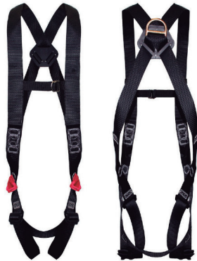
CINTO PARAQUEDISTA SIMPLES HL009 HERCULES CA 36652