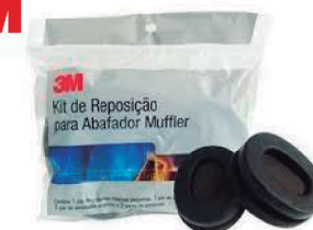
KIT REPOSIÇÃO ABAFADOR MUFFLER - 3M