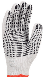
LUVA PIGMENTADA YELING CA 37500