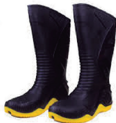
BOTA MOTOSAFE CA 34798