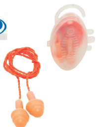
PROTETOR AURICULAR DYSTRAY CA 15485