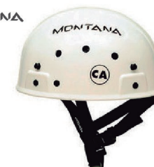
CAPACETE MONTANA FOCUS CA 14816