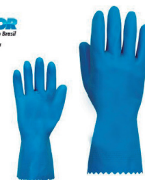
LUVA PVC SEM FORRO PUNHO 25CM, 35CM, 45CM PLASTCOR - CA 34593