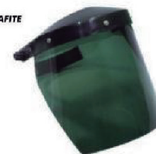
PROTECTOR FACIAL VERDE COM CATRACA 8 CARBOGRAFITE - CA 14276