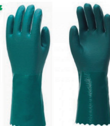
LUVA PVC FORRADA PROMAT PUNHO 25CM, 35CM, 45CM E 70CM - CA 34570