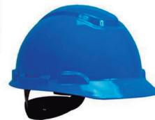
CAPACETE 3M H700 CC AZUL CA 29638