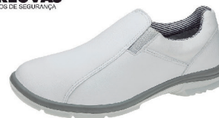
TÊNIS MARLUVAS CA 37179