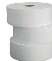
PAPEL HIGIENICO 300 E 500M BIG ROLL