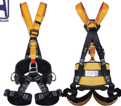
CINTO PARAQ. 4 PONTOS DE ANCORAGEM HL005ST HÉRCULES - CA 36654