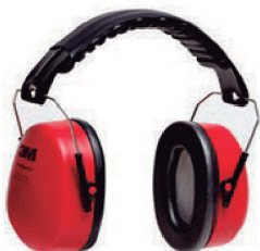
ABAFADOR POMP MUFFLER 3M CA 14235