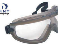
ÓCULOS FENIX CINZA CA 9722