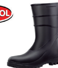
BOTA PVC BRACOL CANO CURTO OU EXTRA CURTO, CORES BRANCO OU PRETO - CA 26629

TREVENTOS SEGURANÇA DO TRABALHO & LIMPEZA PROFISSIONAL