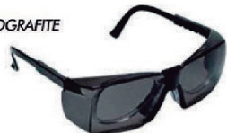
ÓCULOS DELTA CINZA SOBREPOR CA 12927