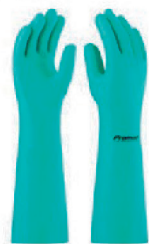
LUVA NITRILICA 45CM CA 31945