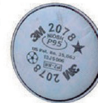
FILTRO MECA, VAPORES ORGANICOS GASES ÁCIDOS 2078 3M