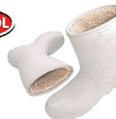
BOTA PVC BRANCO TÉRMICA CC BRACOL CA 26576