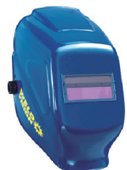
MÁSCARA WORKING WELD VISION CA 17657