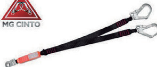
TALABARTE "Y" FITA C/ ABSORVEDOR DE ENERGIA MULT 1892G