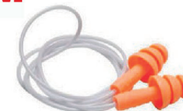
PROTETOR AAUD PLUG SILIC POMP PLUS 3M - CA 5745