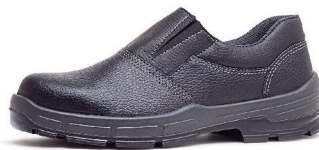
SAPATO DE ELASTICO BSE BRACOL CA 28268