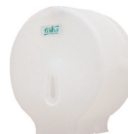
DISPENSER PORTA ROLÃO 300-600M TRILHA