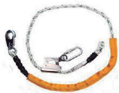
TALABARTE DE POSICIONAMENTO HLO32AJ HERCULES