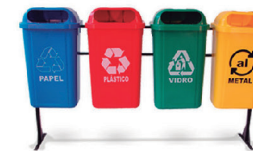
KIT COLETA SELETIVA BRALIMPIA