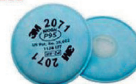
FILTRO POEIRAS/NEVOAS 2071