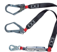
TALABARTE "Y" COM DUPLO ABS HLO3250Y HERCULES