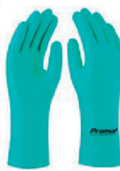
LUVA NITRILICA 35CM CA 31945