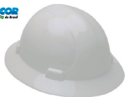
CAPACETE ABA TOTAL PLASTCOR CA 25883