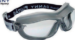
ÓCULOS PLUTÃO INC S/TAMANHO - CA 14883