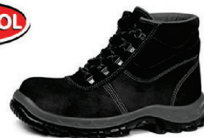
BOTA NOBUCK PT BRACOL CA 26706