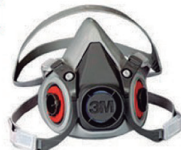
RESPIRADOR SEMI FACIAL 3M (6200MD E 6300GD) - CA 4415