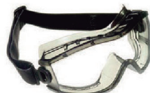
ÓCULOS AMPLA VISÃO EVOLUTION INC - CA 29616