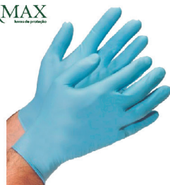
LUVA DE PROCEDIMENTO NÃO CIRURGICO NITRILICO P,M,G SUPERMAX - CA 19520