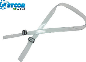
JUGULAR EM SILICONE PLASTCOR