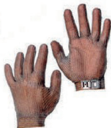
LUVA DANNY ANTI-CORTE NIROFLEX P, M, G, XG - CA 6257