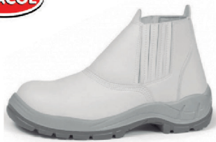
BOTA DE ELASTICO MICROFIBRA BRACOL CA 29492