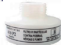
FILTRO 410 P2 AIR SAFETY