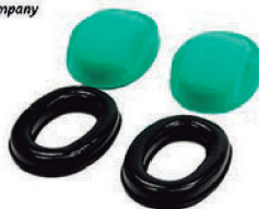
KIT HIGIENE PARA XLS - MSA CA 13763