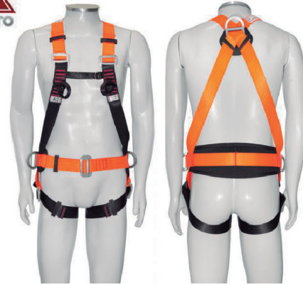
CINT PARAQUEDISTA ABDOMINAL 3 PONTO DE ANCO MULT 2010 - CA 35520