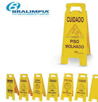
PLACAS DE SINALIZAÇÃO