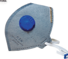
RESPIRADOR PFF2 AZ VALV KSN CA 8356