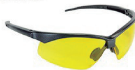
ÓCULOS EVOLUTION AMBAR CA 18697