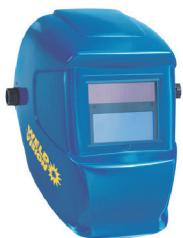
MÁSCARA MASTER WELD VISION CA 17657