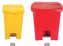
CESTO QUADRADO COM PEDAL JSN