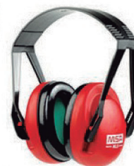
PROTETOR ABAF DE RUÍDO XLS MSA - CA 27971