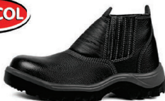
BOTA PT ELAST C/ BC PU BD BRACOL CA 32629