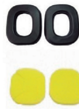
KIT REPOSIÇÃO ABAFADOR ATR