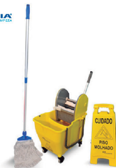
KIT BALDE DOBLÔ BRALIMPIA