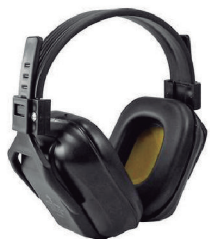
ABAFADOR ATR AGENA CA 269