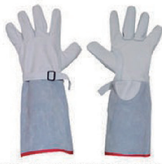
LUVA DE COBERTURA CA 30370