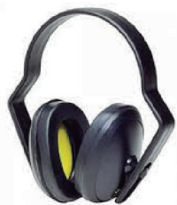
ABAFADOR SPR AGENA CA 4398