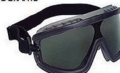
ÓCULOS AMPLA VISÃO EVOLUTION CINZA - CA 29616