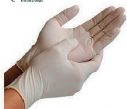
LUVA DE PROCEDIMENTO NÃO CIRURGICO P, M, G SUPERMAX - CA 13030