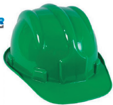
CAPACETE PLASTCOR VERDE CA 31469