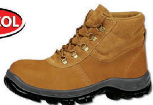
BOTA NOBUCK MAR. BRACOL CA 26706