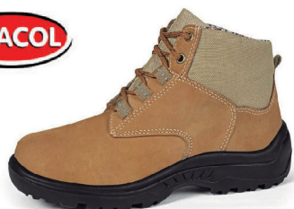
BOTA NOBUCK FEMME CA 26706