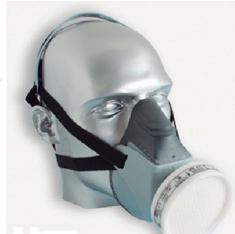
MASCARA AIR SAN CA 12973