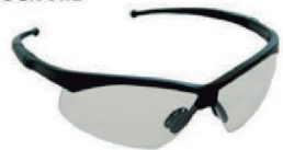
ÓCULOS EVOLUTION INC. ANTIEMB. CA 18697