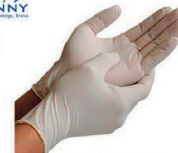
LUVA VINIL DANNY C/ OU S/ AMIDO P, M, G - CA 21120