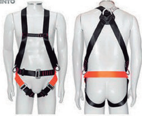
CINT. PARAQUEDISTA 1 PONTO DE ANCO. MULT 2013 MG CINTO - CA 35509