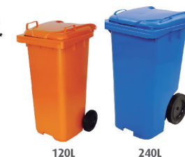
CONTENTOR PLÁSTICO JSN