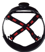
SUSPENSÃO COM CATRACA 3M