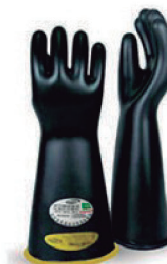
LUVA DE ALTA TENSÃO 2,5KV; 5KV;10KV E 20KV