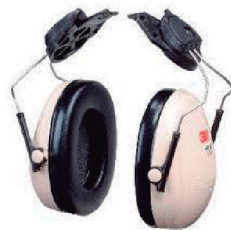
ABAFADOR PELTOR ACOPLÁVEL 3M CA 297036