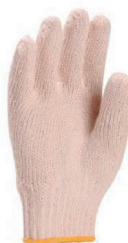
LUVA DE ALGODÃO YELING CA 14622