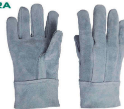
LUVA DE RASPA 07CM E 20CM CA 29328