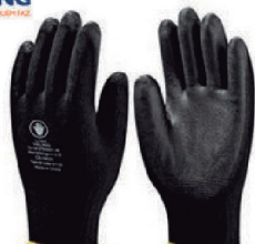
LUVA TRICOTADA COM BANHO EM PU - CA 14628