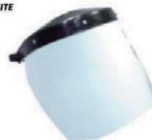
PROTECTOR FACIAL INCOLOR COM CATRACA 8 CARBOGRAFITE - CA 11442