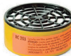
CARTUCHO RC 203 CARBOGRAFITE CA 7072