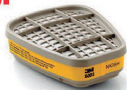
CARTUCHO VAP/ G.ÁCIDOS 6003