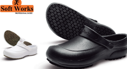
CALÇADO SOFT WORKS CORES PRETO E BRANCO - CA 27921