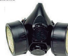
MASCARA CG 306 CARBOGRAFITE CA 7072