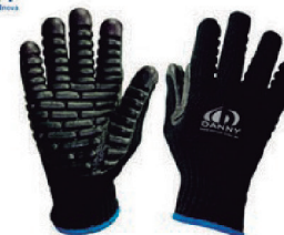
LUVA VIBRAFLEX G/ SEM COR DANNY - CA 18145