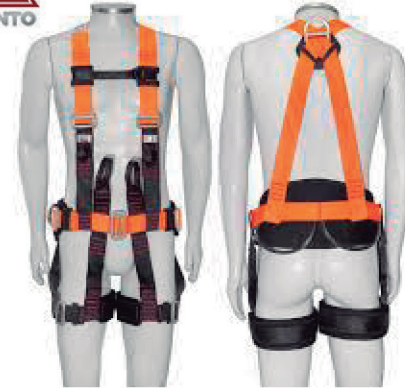
CINTO PARAQ. ABDOM. ELETRIC. ENGATE AUTOMAT. MULT1891 - CA 35521