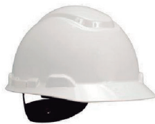
CAPACETE 3M H700 CC BRANCO CA 29638