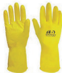
LUVA DE LÁTEX NEOPRENE DANNY P, M, G - CA 15532