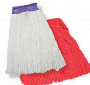
REFIS MOP LIQUIDO BRALIMPIA