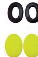
KIT REPOSIÇÃO ABAFADOR SPR