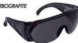
ÓCULOS PRO-VISION CINZA