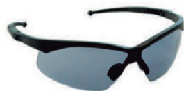
ÓCULOS EVOLUTION CINZA ANTIEMB. - CA 18697