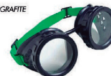
ÓCULOS DE SOLDA MAÇARIQUEIRO CA 29616