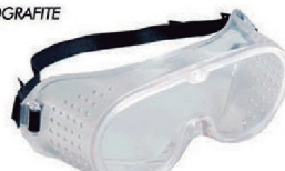
ÓCULOS AMPLA VISÃO PERF. CA 6874