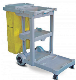
CARRO FUNCIONAL AMERICA BRALIMPIA